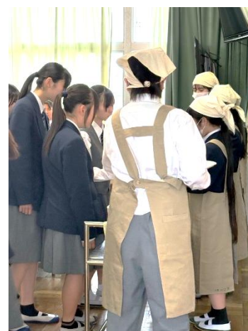
給食準備のお手伝い