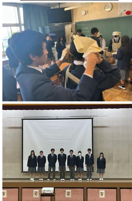
給食準備のお手伝い

3年生の学年目標は「実現」～責任と他者への思いやり～です。昨年度の「飛躍」で培った対話を土台に、自分の進路や目標を主体的に考え、実現していく学年です。そのために「責任」と「他者への思いやり」を大切に、受験に向き合いながら自ら選択し、その結果に責任をもつ力を育てます。また、不安や悩みを抱える仲間寄り添い、支え合いながら安心・安全な学校生活を築いていきます。さらに、4月6日の週の給食準備や生徒会ガイダンスで1年生を支えた経験や、4月17日(金)のオーケストラ鑑賞教室での経験を生かし、「実現」にふさわしい3年生の姿を期待しています。