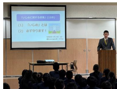
校長先生によるいじめの授業

5月からは二中の二大行事である体育大会に向けて、各クラスで作戦会議や練習を重ねていきます。学習も行事も全力で、みんなで力を合わせて取り組んでくれることを期待しています。